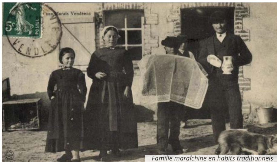
Famille maraîchine en habits traditionnels